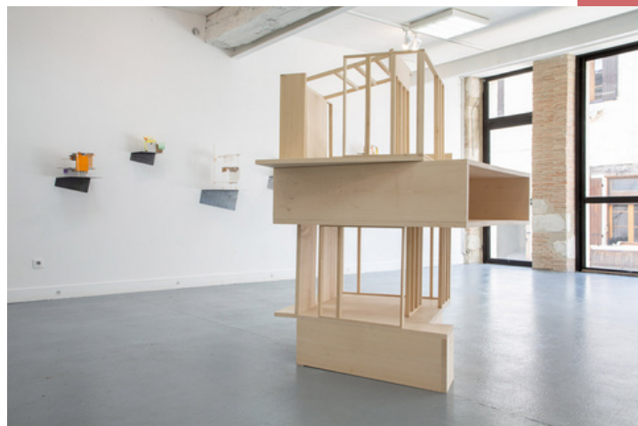
Exposition de Mengzhi Zheng 2020