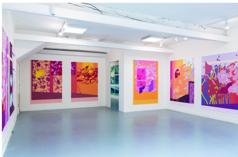
Exposition de Marina Vandra 2021

Les candidats présélectionnés sont le cas échéant sollicités par la suite pour des entretiens prétextes à la découverte du site et de ses spécificités. En raison du nombre de candidatures seuls les artistes présélectionnés après les comités de sélection sont éventuellement reçus en entretien. Seuls deux candidatures sont retenues au terme de chaque processus de sélection.