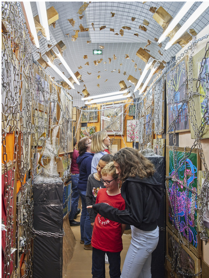
Thomas Hirschhorn. Sas de contamination, 2000. Installation. Trente-huit panneaux de bois, socles en bois, feutrine, grillage, chaînes, sacs-poubelle, néons, images imprimées, peintures originales, carton, adhésif, divers objets et bibelots, bois de cerf, quatre écrans avec vidéos Dimensions variables. Panneaux : 261 x 160 x 65 cm environ chacun. FNAC 2022-0380. Donation Yvon Lambert en 2012. Collection Centre national des arts plastiques en dépôt à la Collection Lambert.

En introduction à Une histoire intime de l'art , la Collection Lambert expose l'œuvre de Thomas Hirschhorn, Sas de contamination , créée spécialement pour l'inauguration en 2000 de la Collection Lambert et jamais remontrée depuis. Questionnant sans cesse le rôle de l'art dans notre société, Thomas Hirschhorn réalise ici une installation qui s'entend comme une architecture que le spectateur pénètre et éprouve.