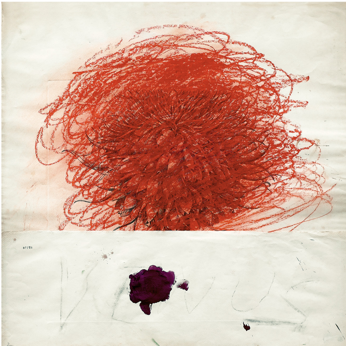
Cy Twombly. Pan (détail), 1980.

COLLECTION LAMBERT, AVIGNON 25 MARS – 4 JUIN 2023