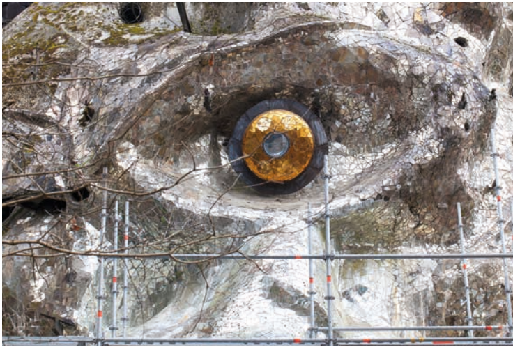
Niki de Saint Phalle, Face aux miroirs , FNAC 95419 (7), vue de l'œil du Cyclop Vue du chantier de restauration, avril 2021 © Niki Charitable Art Foundation / Adagp, Paris, 2021 / Cnap