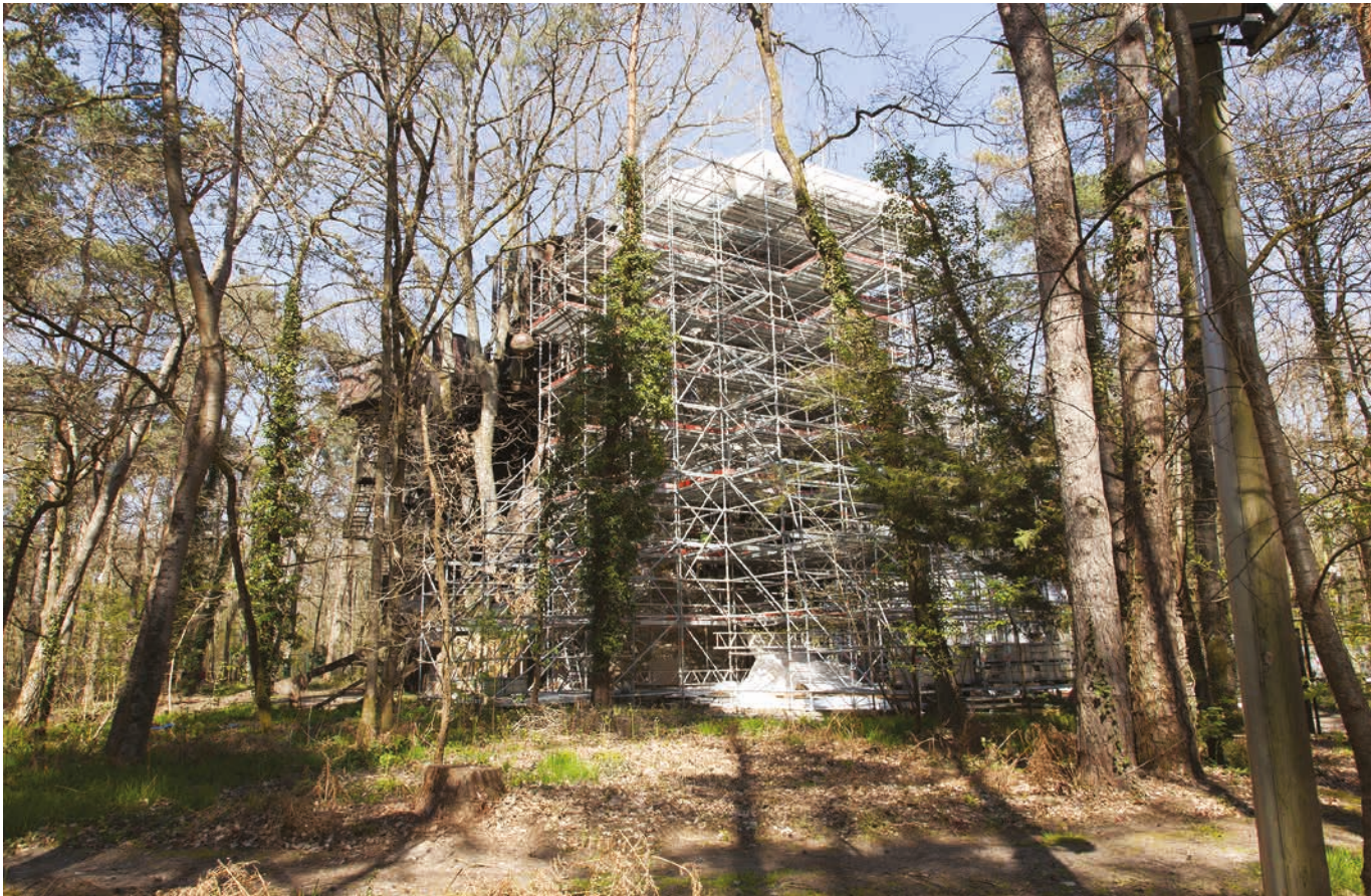
Jean Tinguely, Le Cyclop, 1969-1994, FNAC 95419 Vue du chantier de restauration, avril 2021