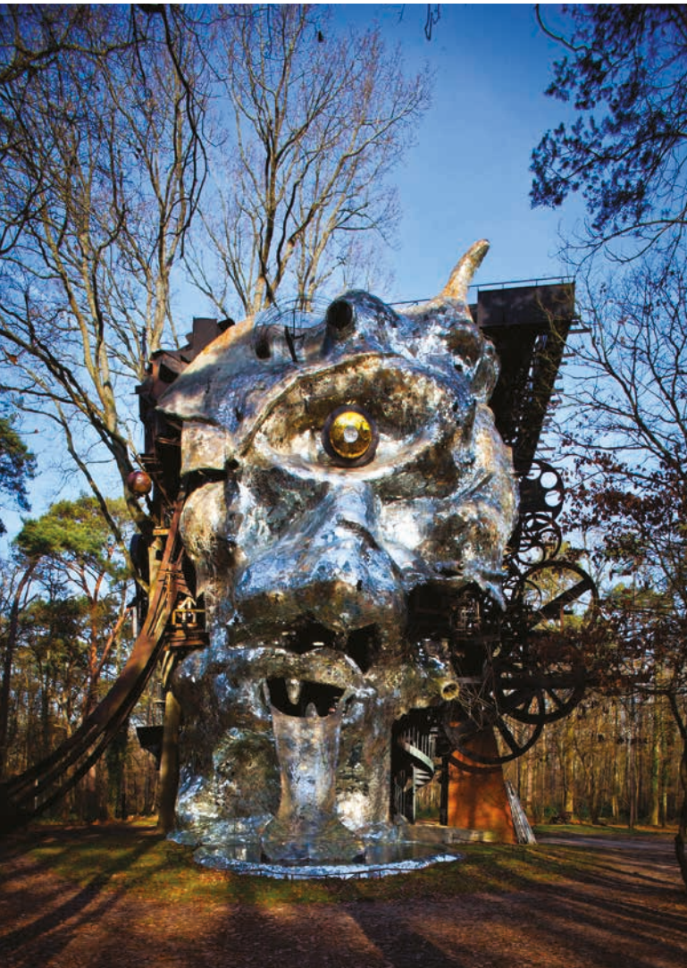
Niki de Saint Phalle, Face aux miroirs, FNAC 95419 (7) Œuvre réalisée pour Le Cyclop, 1969-1994

Le Centre national des arts plastiques a lancé en mars 2021 le chantier de restauration du Cyclop , œuvre d'art total initiée par l'artiste suisse Jean Tinguely au cœur des bois de Milly-la-Forêt dans l'Essonne. Le site a fermé ses portes en octobre 2020 pour laisser place à un vaste chantier de restauration qui va durer un peu plus d'une année. Son ouverture au public est programmée pour le mois de mai 2022.