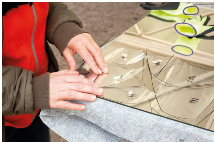
Création des gabarits pour la découpe des miroirs Vue du chantier de restauration, mai 2021