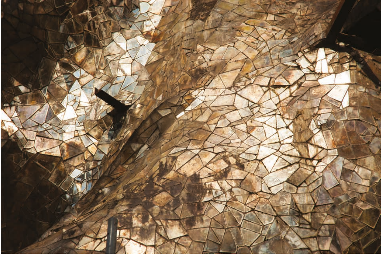
Niki de Saint Phalle, Face aux miroirs , FNAC 95419 (7), détail des miroirs Vue du chantier de restauration, mars 2021 © Niki Charitable Art Foundation / Adagp, Paris, 2021 / Cnap