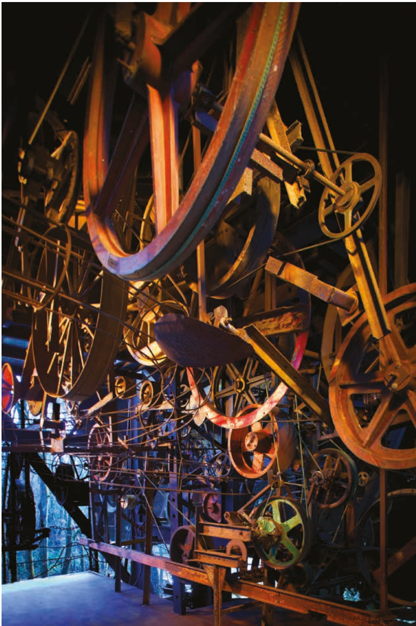
Jean Tinguely, Méta-Harmonie, FNAC 95419 (25) Œuvre réalisée pour Le Cyclop, 1969-1994