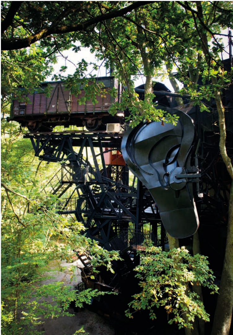
Eva Aeppli, Hommage aux déportés, FNAC 95419 (1) Bernhard Luginbühl, L'oreille, FNAC 95419 (18) Œuvres réalisées pour Le Cyclop, 1969-1994