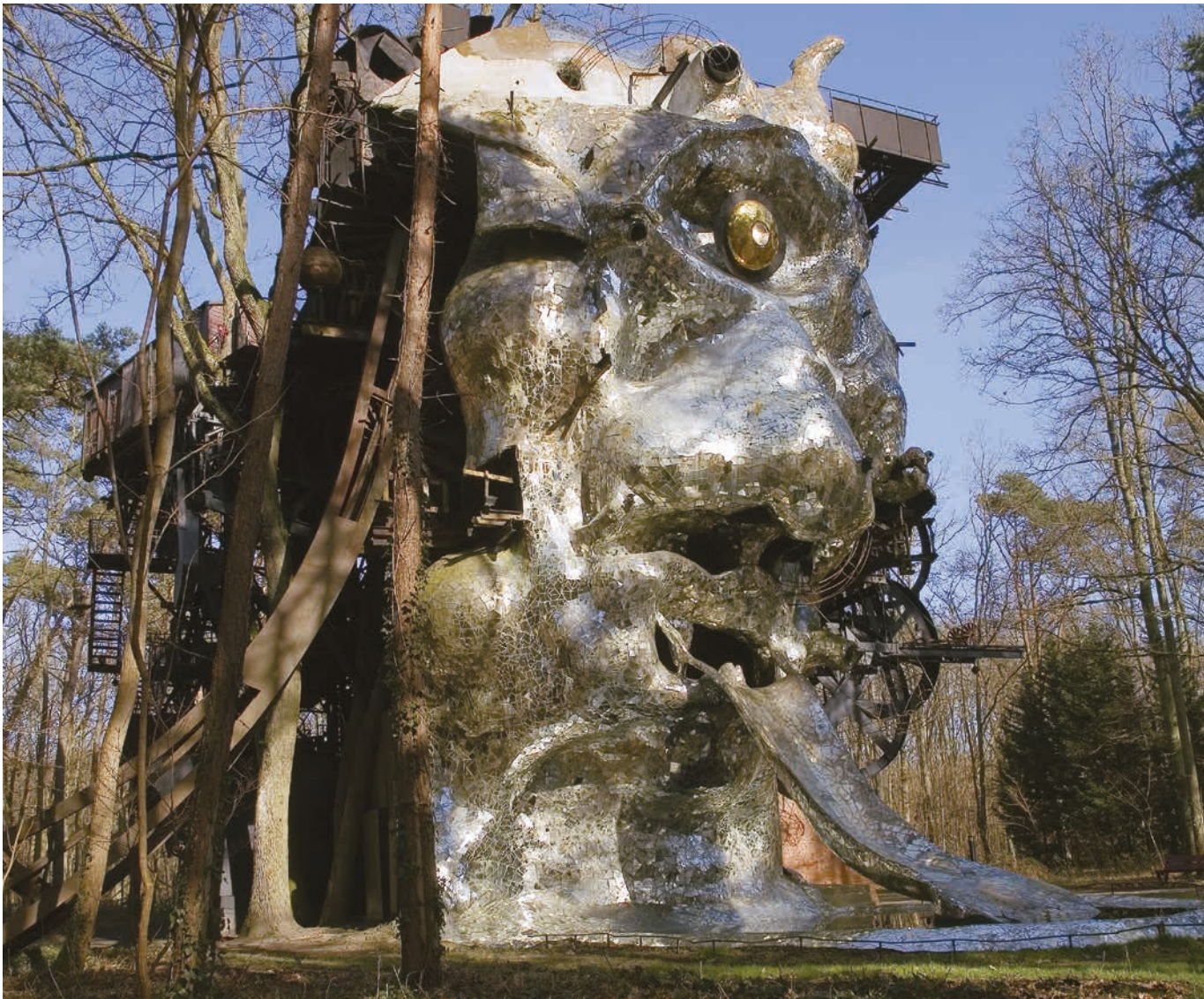
Jean Tinguely, Le Cyclop, 1969-1994, FNAC 95419