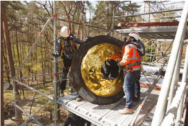
Niki de Saint Phalle, Face aux miroirs , FNAC 95419 (7), démontage de l'œil du Cyclop avant restauration Vue du chantier de restauration, mai 2021 © Niki Charitable Art Foundation / Adagp, Paris, 2021 / Cnap Crédit photo : Camille Verrier