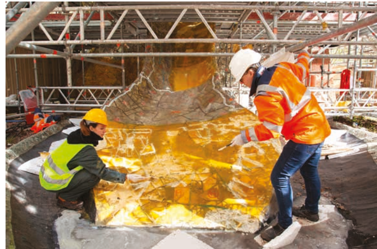
Niki de Saint Phalle, Face aux miroirs , FNAC 95419 (7), prise des empreintes des miroirs de la langue au latex Vue du chantier de restauration, mai 2021 © Niki Charitable Art Foundation / Adagp, Paris, 2021 / Cnap Crédit photo : Camille Verrier